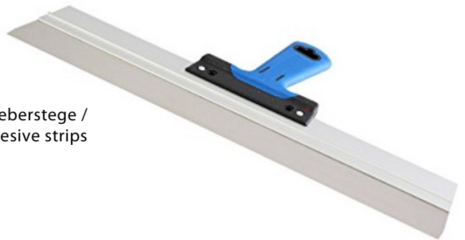
Flächenspachtel zum glätten der Kleberstege / Adhesive spreader/finishing spatula to draw off the adhesive strips