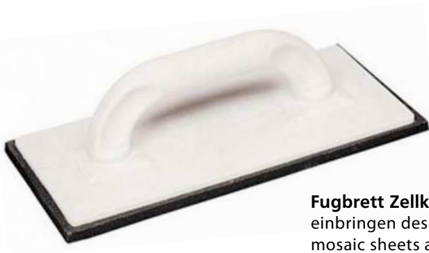
Fugbrett Zellkautschuk zum andrücken/ausrichten der Mosaikbögen und einbringen des Fugenmörtels / Rubberized rub board to press and align the mosaic sheets and the grout is applied into the joints