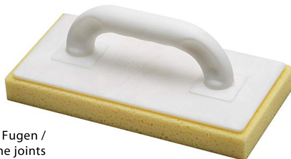
Schwammbrett zum formen der Fugen / Sponge board to shape the joints